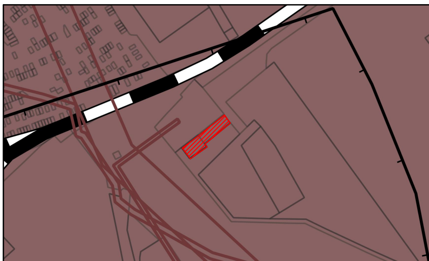
Фрагмент карты территорий и зон с особыми использованиями территории (Генеральный план Муниципального образования городского округа «город Орёл»)